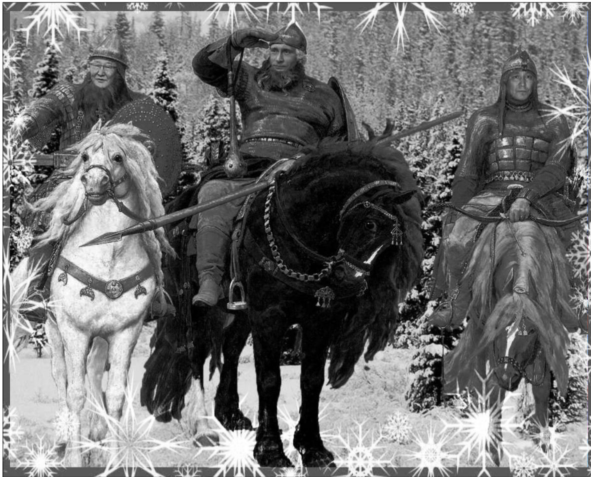
Үтүө үгэс үөдүйдүн