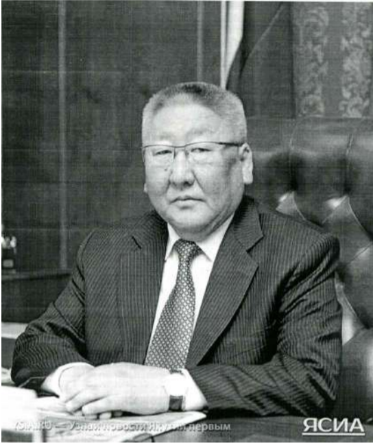
һын сокуонунан бигэргэммитин республика быһылыгы э.т. эттэ.

Көрдөрөр — иһитиннэрэр тиһиктэргэ болдьоҕу иннинэ быыбар туһунан кэлинги нэдиэлэҕэ элбэх сурулларын, этиллэрин Егор Борисов таарыйда. Кини Россия политическай систимэтигэр киирэрэ уларыйылар дойдуга субъектарыгар элбэх болуочуларын биэрэллэрин, ону таһынан регионнар баһылыктарын быыбардаа-