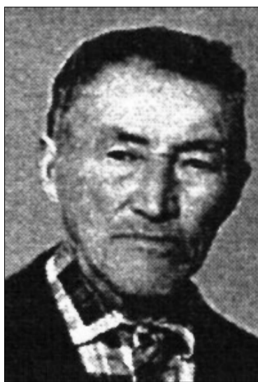
Что я знаю о войне? Шесть-