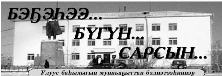
Улуус баһылыгын мунһабыттан бэлиэтэһиннэр

1996, 2005 сылларга республика бастыг хаһыата