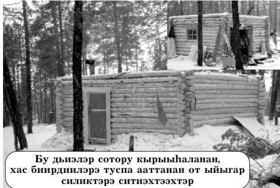
Бу дьизэлэр сотору кырыһыаланан, хас бириддилэрэ тупса ааттанан от ыйыгар силиктэрэ ситиэхтээхтэр

Биллэн турар, манньк кэлимник туристическай базаны тэрийии элбэх сыраны, ону тэнэ үгүс үбү эрэйэрэ өйдөнөр. Былырыын 150 тыһ. солк. грант сүүйэн, онуоха эбии кредит булан 3 дьыни толору төлөһөн кэлбиттэр. Мантан салгыы ханна сатанарынан грант уонна предпринимательство салаатынан чэпчэтиилээх кредит туһугар киирсэр санаалаах. Билигин баар дьизэлэри кырыһыаларын туруоран, территорияны тупсафай оҥорон от ыйын саҕатыгар туристическай базаны официальнойдык арыян сынньанар дьону көрсүбүтүнэн барыахтаахтар. Дьининэн эттэххэ, биһиги улууспутугар баччааҥна дизри Дьокуускайтан кэлэр бьылдыттарбыт ханна түбэһиэх балаакканан, быс-