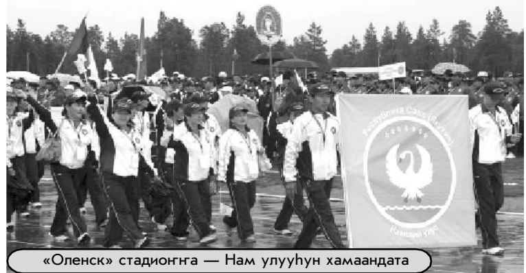
«Оленск» стадионна — Нам улууһун хамаандата