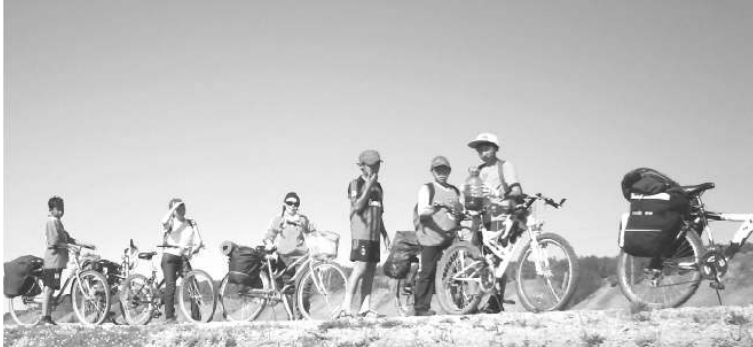
Биһиэхэ барыта саҥа, дыкты, интэриэһинэй

хаалбыппын, олору көрөн наһаа астынным. Элбэх буолан сылды-ыбыппыт үчүгэй этэ. Саамай кылаакка тэн сыһыалаһытын туһалаахтык атаарбыт. Хачыкаат-Аллараа Бэстээх паромга мин уруулу тутар чизскэ тиксипитим. Велосипед киһи күүстээх буоларыгар туһалаах. Мин аҕам курдук күүстээх буолуохпун баҕарабын. Оҕолорго велосипедынан элбэхтик хатааһылаан дьээн сүбэлэ-эм этэ.