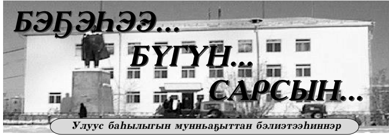
Улуус баһылыгын мунһабыттан бэлиэтээһиннэр

1996, 2005 сылларга республика бастыг хаһыата