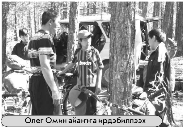
Олег Омин айанга ирдэбиллээх

көрсүүлэрэ биһиэхэ наһаа күндү түгэн этэ.