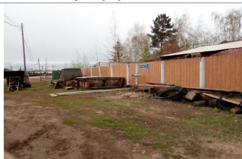
Сагарбат буолуохха сатамат!

Олонхо ыһааҕар бэлэмнэни чэрчитинэн, СР административнай быраабы кэһиилэрин Кодексын 6.25 ст. олобуран, «Нам улууһа» МТ административнай комиссията нэһиликтэр дьаһалталарын кытта территориялары хомуйууга рейдэлэри ыттар. Ол курдук, бэс ыйын 7 күнүгэр дьэри Нам сэл., Хамаҕатта уонна Никольскай бөһүөлөктэригэр быстах рейдэлэр ытыллынылар. Нам сэл. - 65, Хамаҕатта — 9, Никольскайга — 4, Аппааныга — 7, Граф Бизэргэр — 2 акта толорулунна.