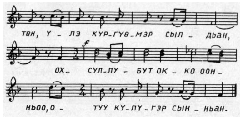
З.П. Винокуров мел., Чабылдан тыл.

Үөрэх бүтэн, күөххэ көтөн, Үлэ күргүөмөр сылдьан, - Охсуллубут окко оонньоо, Отуу күлүгэр сынньан. Оҕо дьоннор, ойдом баран От охсон оймоотубут, Кэриэнинэн кэлэ-кэлэ Көккөлөччи түстүбүт.