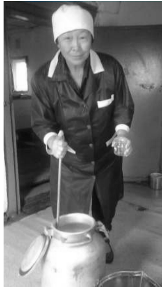
лар. Окко кирири иннинэ А. Барашкова нэһилиэнньэт-тэн сайаапка хомууйан Дьо-

куускайтан ГСМ, соларка аһалтарда, онон дьон оттуур уматыгы хааччына».