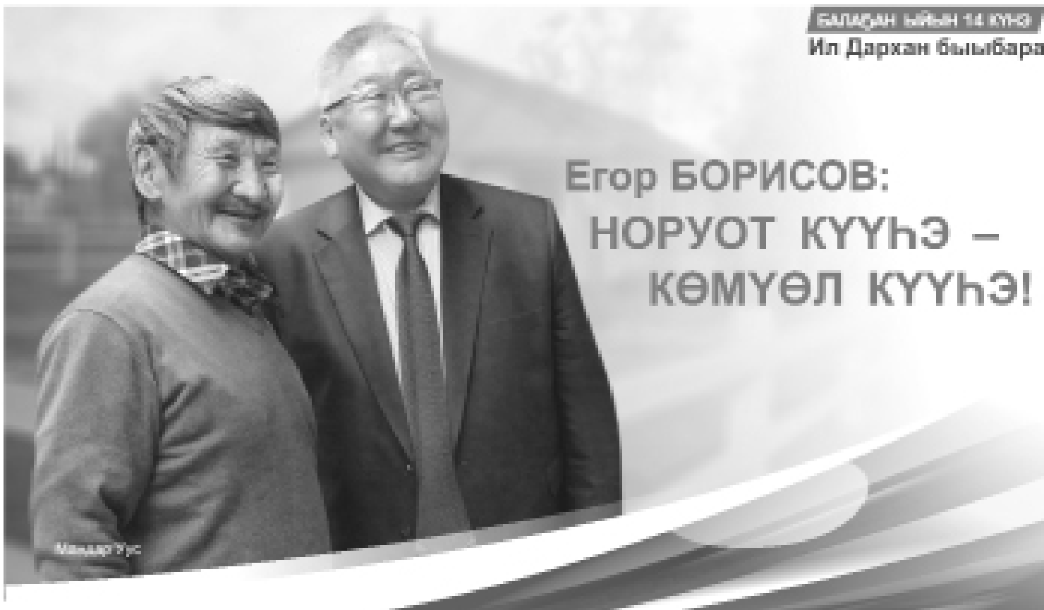
БАЛАҒАН ҪҮҮН 14 КҮНЭ Ил Дархан быыбарга

Егор БОРИСОВ: НОРУОТ КҮҮНЭ – КӨМҮӨЛ КҮҮНЭ!