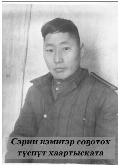
Сэри кэмигэр соҕотох түспүт хаартыската

рин, биир да сыһата суох суруйарын билэһинэр штабка суруксутунан анаабыттар эбит. Онтон 1945 сыл атырдыах ыйыгар Япония арми-