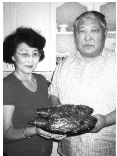
Кыһыл искэх, хара ол Олус-олус миннигас, Хантан кэлэн тэнгэһиэй Манна, ама, хайа ас...