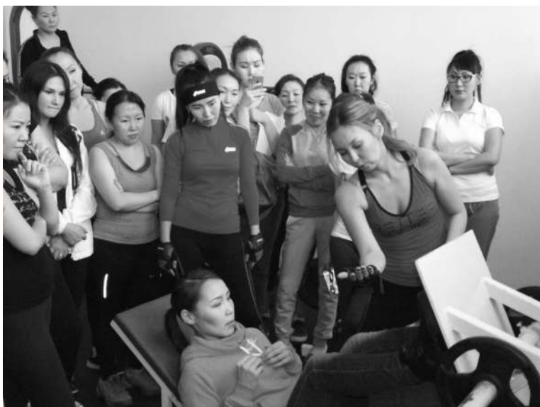
ылыахха сөп. Онон Янда Анато-льевна саалга баар хас биердии тренажерга сөпкө дьарыктанары көрдөрбүтүн кэннэ, кыргыттар сүбэ-ама ылан холонон көрдүлэр. С. АРГУНОВ