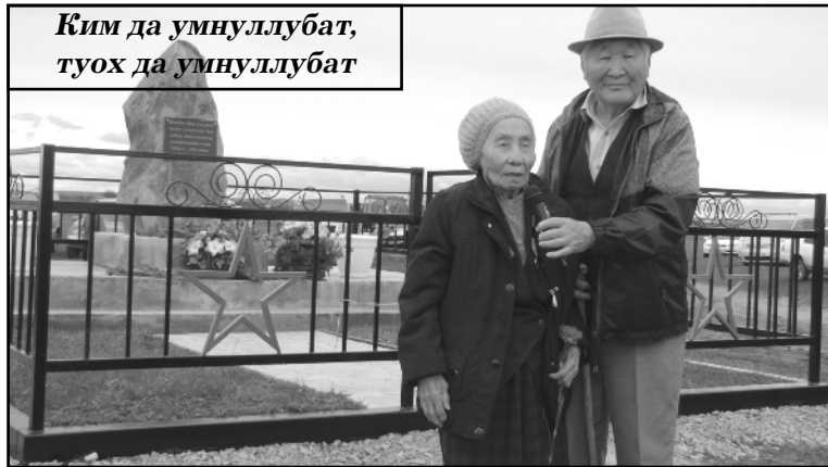
Ким да умнуллубат, туох да умнуллубат

1996, 2005, 2009 сылларга «Сыл бастыг хаһыата»