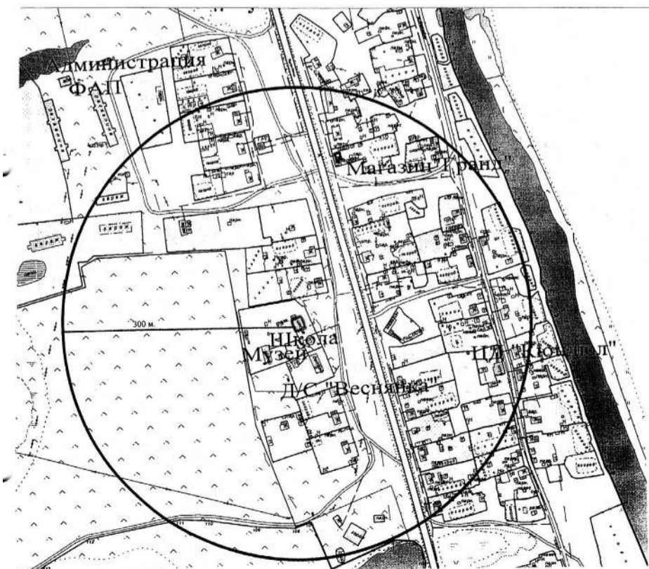
СХЕМА расположения общеобразовательного учреждения, Никольская начальная школа.

□ -Никольская НОШ: Намский улус, с. Никольский ул. Е.Протопопова 12. □ -Магазин «Гранд»: Намский улус, с. Никольский ул. Е.Протопопова 57.