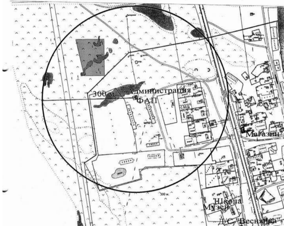
СХЕМА расположения медицинского учреждения, Никольский ФАП.

□ -Никольский ФАП: Намский улус, с. Никольский ул. Е.Протопопова 32. □ -Магазин «Гранд»: Намский улус, с. Никольский ул. Е.Протопопова 57.