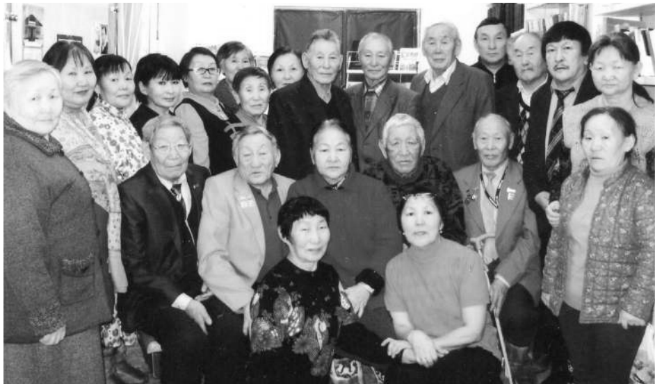
Дойдубар тапталбын туойаммын.

Бу хоһоонго поэт күүстээх санаалаабын, талаанын чопчу билинэрин, бу күн сиригэр олонор, киһи барахсан туох эрэ үйэлээһи, чопчулаан, бэйэтэ этэрини: «Уларсык кэлэргин умнума», – диэбитини, киһи бэйэтин кэнниттэн солбулар ыччаттанан, туох эмэ үйэлээһи хаалларан барара хайаан да наадатын тоһоҕолуур уонна ону бэйэтин олоҕо толору дакаастыыр. Кини киһи быһытынан олус сэмэй, холку майгылаах, өрүү сүбэли-амалы сылдыра поэты киһи быһытынан киэргэтэр. Ол эмиз хоһоонноругар көстөр. «Арбимбар бар дьоммор» диэн төрөөбүт-үөскээбит Арбынын дьонун-сэргэтин, айылҕатын анааран үөрүүгө да, хомолтоҕо да, ыарахан кэмгэ да, өрүү биригэ буолан, айартутар аналлаах, аһыныгас санаалаах, аара тохтоон, уолуйан туран хаалбакка, аралдьибакка олоҕу кытта үөрө-көтө, үлэлээн-хамсаан, ыллаан-туойан сылдыһаахха наадатын поэт хоһоонунан алгыыр, дьонугар-сэргэтигэр алгыс тылын