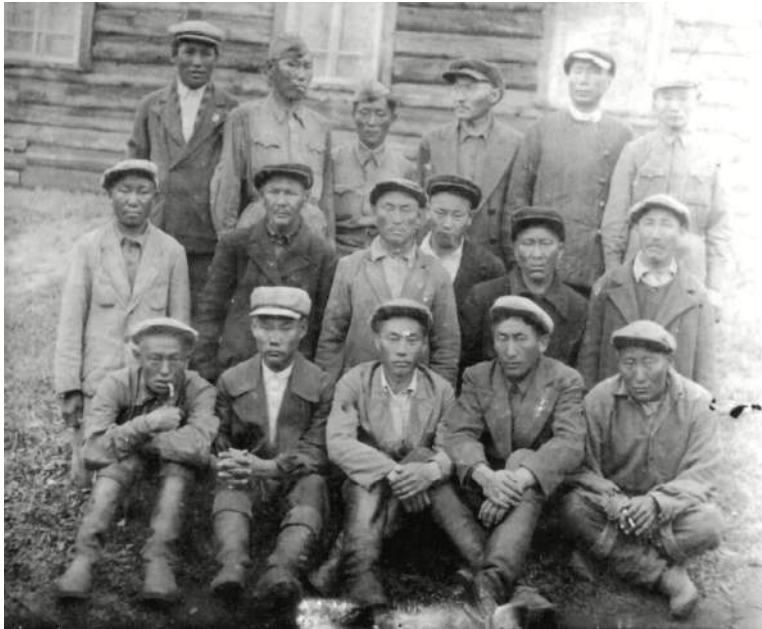
аҕалбыттарыгар махтанан, саатар ааттарын үйэтитиэбин диэн көрдөһөбүн.

Улуу сәригэ, үлэ фронулар сылдыбыт күндү дьоммутугар бу дьоллоох олоҕу