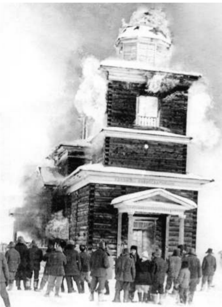
сентября 1885 г. Яковым, Епископом Якутского и Вилюйского».

2. «Храм строился с 1869 г. за счет общества Хомуस्ताхского наслег Намского улуса с разрешения Его Присвещения, Присвещеннейшего Дионисия Епископа Якутского и Вилюйского, окончено и освящено 15