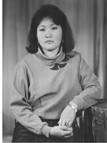
абыт минньигас, тотоойу астарга кэлбит ыалдьыттары үөрдэр. Дьэиэ кэргэнинэн спорду, чөл олоҕу өрө тутан нэһилиэккэ, улууска ытыллар күрэхтэргэ