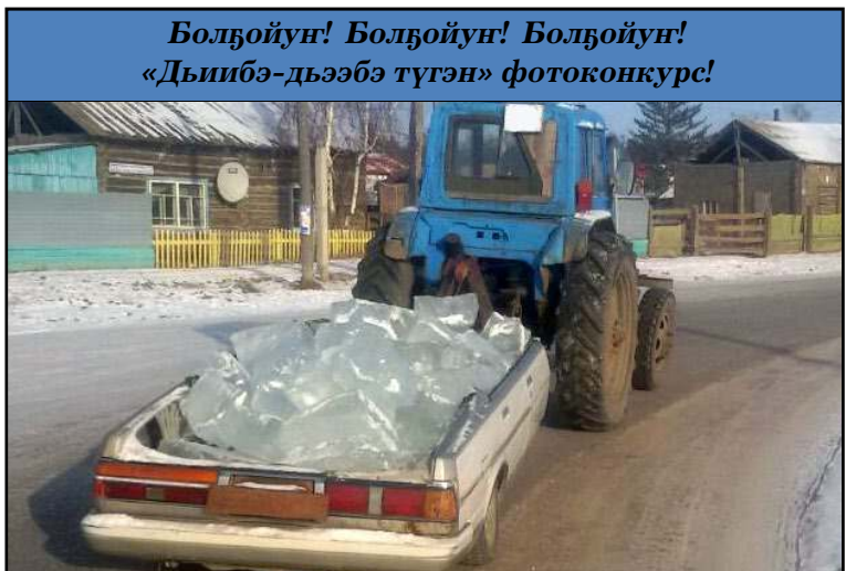
Болдойун! Болдойун! Болдойун! «Дьибэ-дьээбэ түгэн» фотоконкурс!

«Энсиэли» хаһыат редакцията бу нүөмүртэн, ол эбэтэр сэтинньи 8 күнүттэн саҕалаан 2017 с. тохсунньу 5 күнүгэр диэри манньк ааттаах фотоконкурс ытар. Куонкурууска ким баҕарар, сааһыттан, идэтиктэн, ханна олороруттан тутулуга суох, кыттыан сөп. Сүрүн ирдэбилэ — күннээҕи олоххо, эһиги көрүүгүтүгэр дыкти, дьибэ-дьээбэ түгэннэри фотоаппаратынан, телефонунан түһэри уонна e-mail: Namtsy41141@mail.ru , биитэр ватсабынан 89991743680 , 89141062123 тел. ытыабыт.