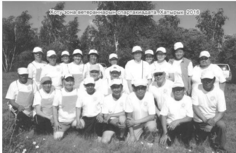
Хоту зона ветераннарын спартакиадата. Хатырык 2016