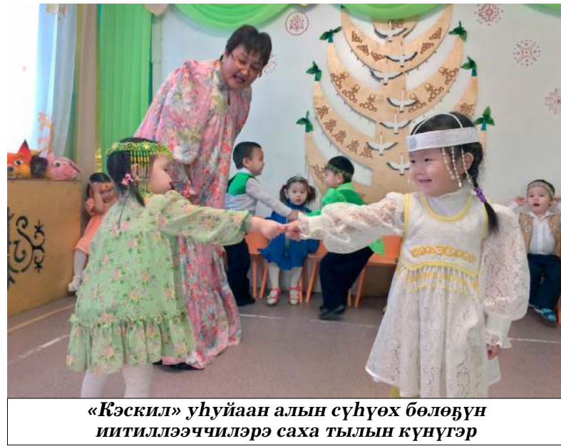
«Кэскил» уһуйаан алын сүһүөх бөлөбүн иитиллээчилэрэ саха тылын күнүгэр

нан 1996 сыллаахха олохтоммута. Семен Андреевич Новгородов Чурапчы оройуонугар төрөөбүтэ. Дьокуускайга реальный училищени бүтэрэн баран, Петроградка 1913 сыллаахтан университетка үөрэммитэ. Онно кини Илинни омукар тылларын кичэйэн үөрөспүтэ. Үөрэнэр кэмгэр саха тылын аанаан үөрөспүтэ, фольклору хомуйбута уонна Саха суругун олохтообута. Бастаан 1917, салгыы 1922 сылга кини бастакы «Сурук-бичик» дьин букубаара, онтон ааҕар кинигэтэ бэчээттэммиттэрэ. Оскуолаҕа ити кинигэлэринэн сахалыы үөрэнэн барбыттара. Сотору балачча элбэх хаһыат, сурунаал, учебник, уус-уран айымньылар бэчээккэ тахсытталыыр буолбуттара. Үөрэбэ суох дьону үөрэхтээһин үлэтэ тэнийбитэ. Оччолорго үгүс кини, оскуолаҕа үөрэммэккэ сылдьан эрэн, сахалыы ааҕар, суруйар буолтара. Семен Андреевич, университеты бүтэрэн баран, санаа үлэлээн иһэн, 1924 сыллаахха Ленинградка 32 сааһыгар эмискэ ыалдьан өлбүтэ. Кини алпаабыта 1929 сыллаахха диэри туттуллубута. Сэбиэскэй былаас сылларыгар тыл үөрэхтээхтэрэ үөскээбиттэрэ. Олортон улахан үтүөлээхтэринэн Алексей Елисеевич Кулаковскай, Платон Алексеевич Ойуунускай, Алексей Андреевич Күндэ буолаллар. Сэри кэниитин Саха тылын научнай боппуостарын үөрэтии ордук кэнээбит. Учуонай истиэпэннээх тылы үөрэтэр дьон элбээбитэ.