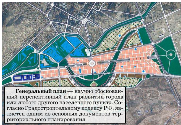
Генеральный план — научно обоснованный перспективный план развития города или любого другого населенного пункта. Согласно Градостроительному кодексу РФ, является одним из основных документов территориального планирования

быраабыланы билэр, эппиэтинэһи табатык өйдүүр буолуохтаах.