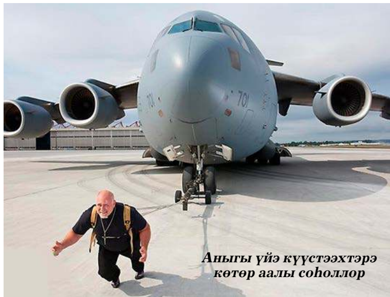
Аныгы үйэ күүстээхтэрэ көтөр аалы соһоллор

көрдөрөн биэрэн эрэннэрбит. Киһитэ ону истэн баран: «Тэбэн көрөрүм дуу, манна баар малгытын хомуйун», — диэбит.