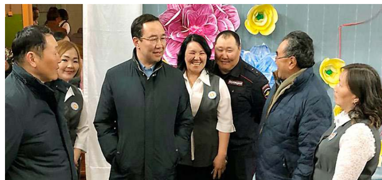
(Бүтүүтэ. Иннин 1 стр. көр)

Кини санаатыгар бюджетнай эйгэни сааһылааһын үрдүк көдүүстээхтик уонна обществоно кытта ыкса сибээстэхтик бытыллыахтаах.