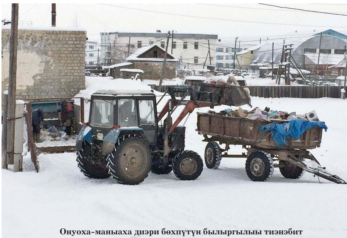
Онуоха-маныха диэри бөхпүтүн былыргылыы тиэнэбит