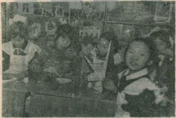
«Бүгүнгү уустук кэмгэ саха дьахталлара уларыа турар олох үөһүгэр сылдылар, үлэ-хамнаска төһүү үлэһиттэр. Кэлэр XXI үйэ онкулун оҕорооччулар.

Кинилэр олохторун усулуобуйатын тунсарарга туһаламмыт анал дьаһаллар олохтооллор, государственнай программалар оҕоһулуунулар, олох олоххо кириилэрэ XXI үйэ оҕолорун тустарыгар боччумнаах харды буолуохтара диир эрэнэбин», — диир биниги Президемиит М. Е. Николаев.