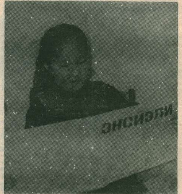
«ЭНСИЭЛИНИ» — ЫАЛ АХСЫН

Нам улуунун дьаһалтатын баһылыга А. Н. ЯДРЕЕВ.