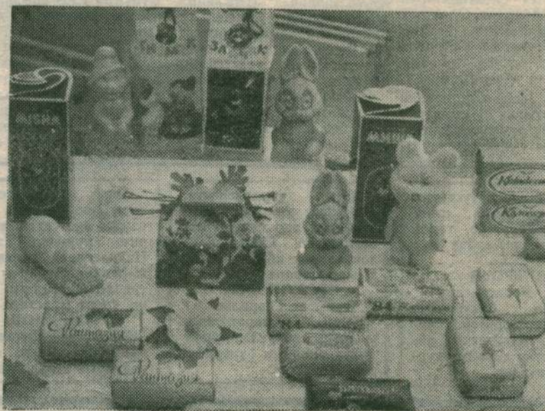
ГИГИЕНА — ПРОЧНАЯ ПРЕГРАДА ИНФЕКЦИЙ