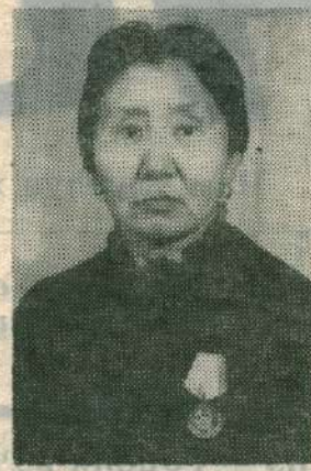
Прокуратура төрүттэммитэ 275 сыла туоларынан билигин улууспут прокуратура-тын туһунан ахтыгы оҕоруох-лун баҕарабын.