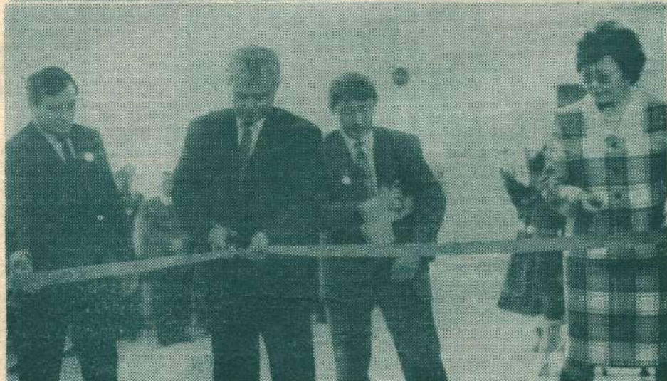
Училище саҥа дьэтин арыһы түгэнэ