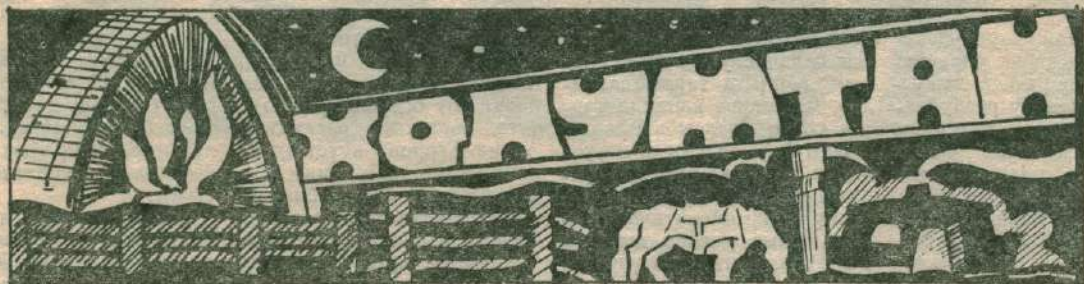
ДЬИЭ КЭРГЭН КИЭНЭЭНИ ТҮМСҮҮТЭ