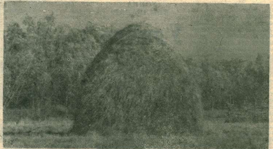
КИМ ТӨӨӨ ОТТОННО?