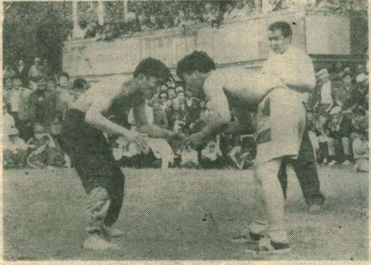
(Иннин 3 стр. көр.)

рүүнү хатын-чаран саба- тыгар суол устун баран ба- ран төннөр гына онгорул- лор. 1500 м-750 м төннөрүн, 10 км сүүрээчилэр 500 м төннөлөр.